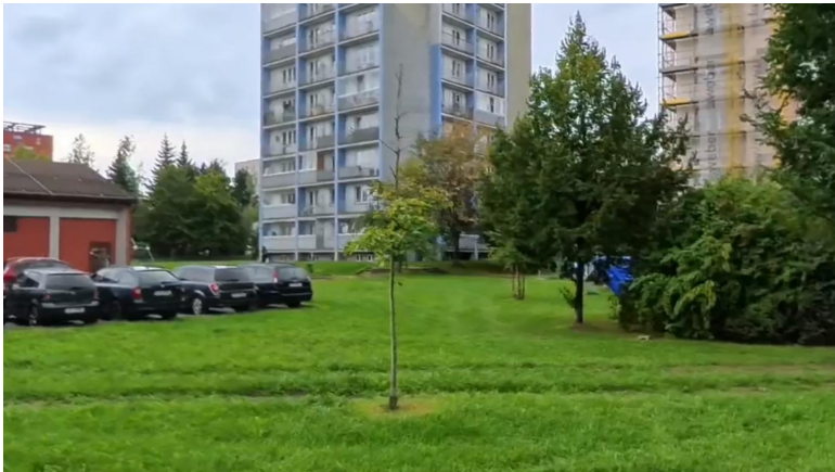
#180 skoro suchý strom