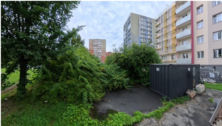
nálet křoviny #2