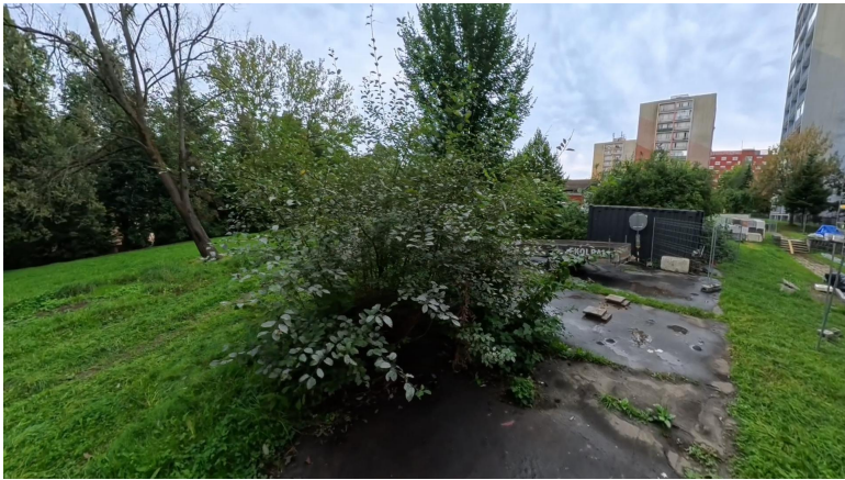
nálet křoviny #1