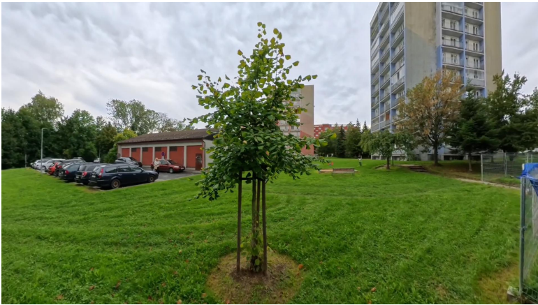
strom k přesazení