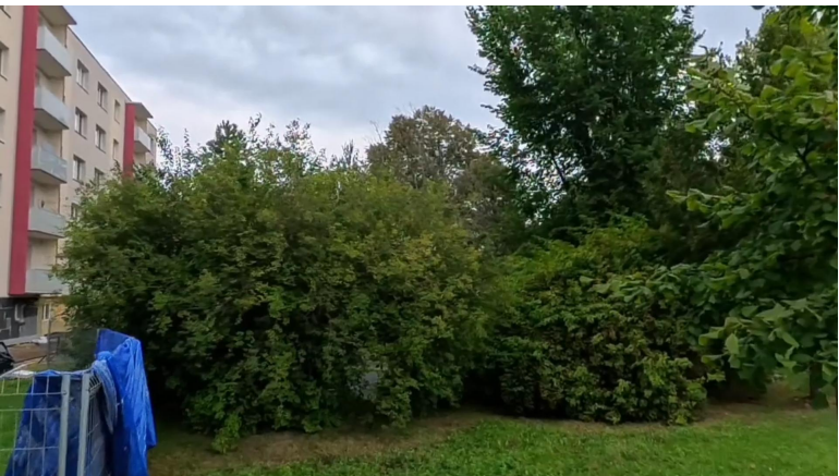
nálet křoviny #3